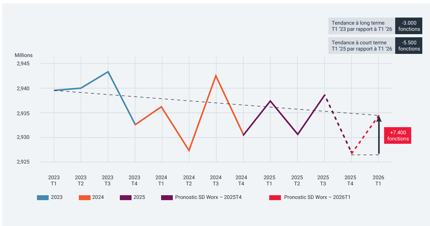
Graphique 1 : Emploi privé (nombre de travailleurs, hors agriculture)